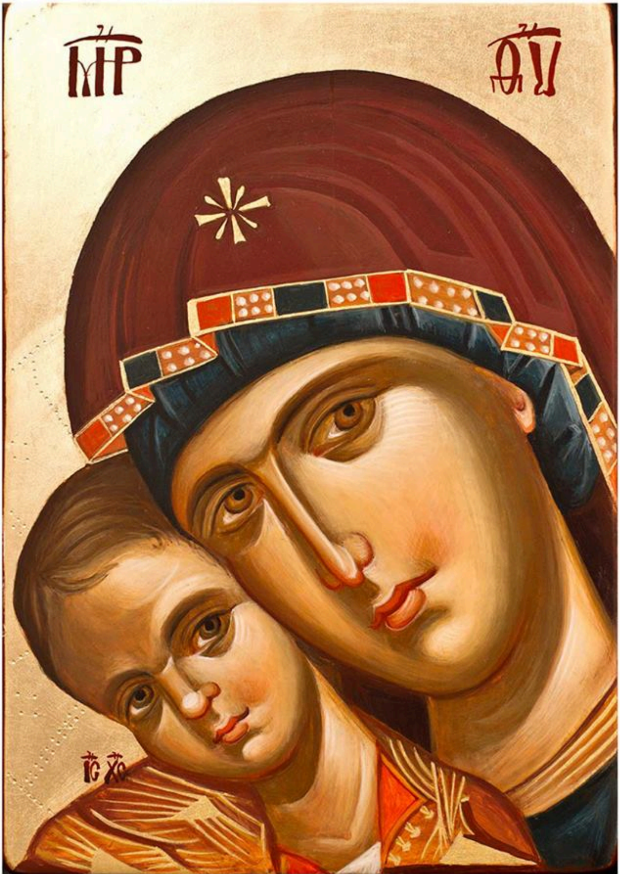
Maica Domnului cu Pruncul- 2015 pigmenți pe blat de lemn, foiță de aur/ 20x30cm