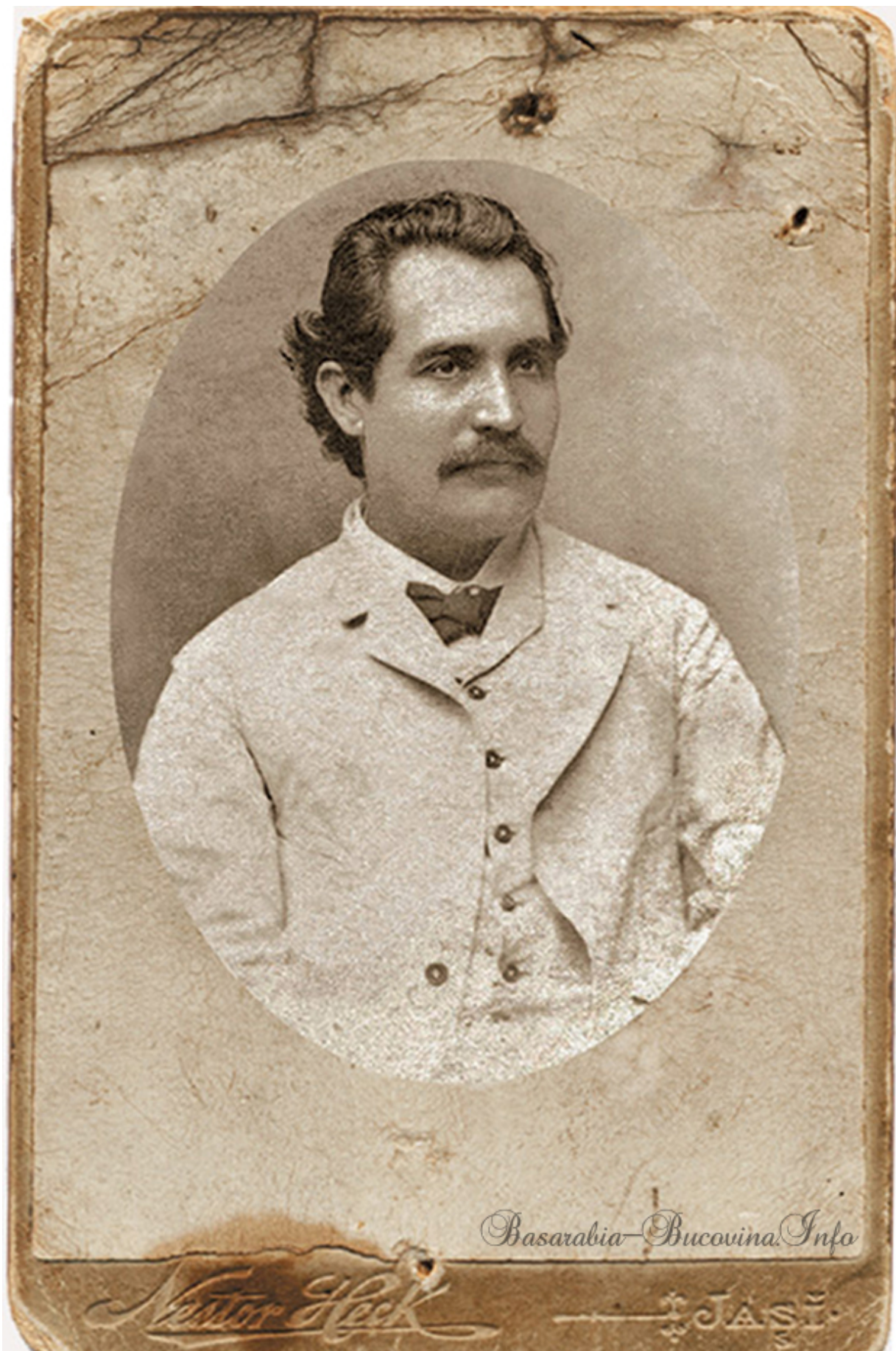
Fotografie de arhiva. Mihai Eminescu de Nestor Heck – 1884. Basarabia-Bucovina.Info