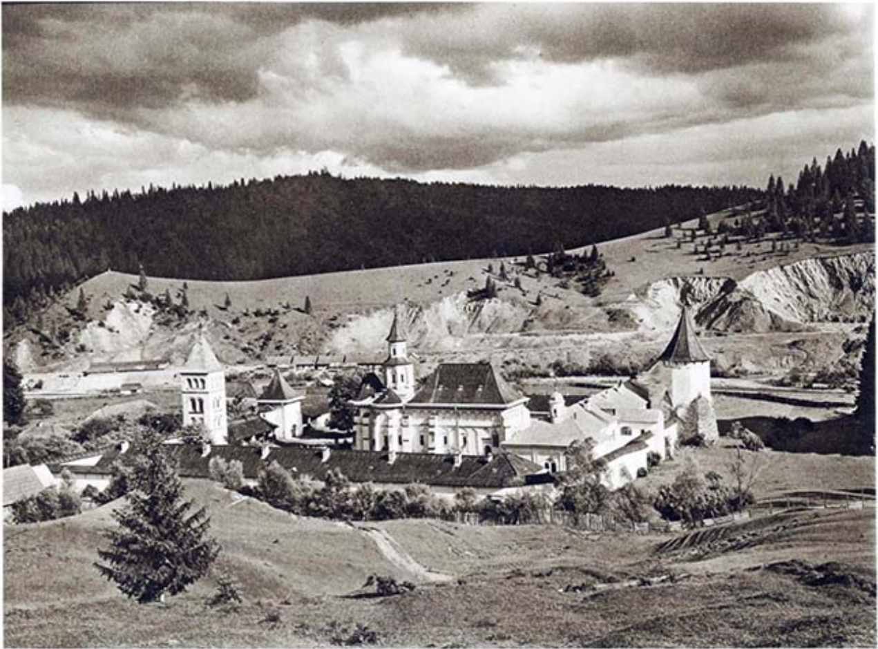
Kloster Putna Putna Monastery