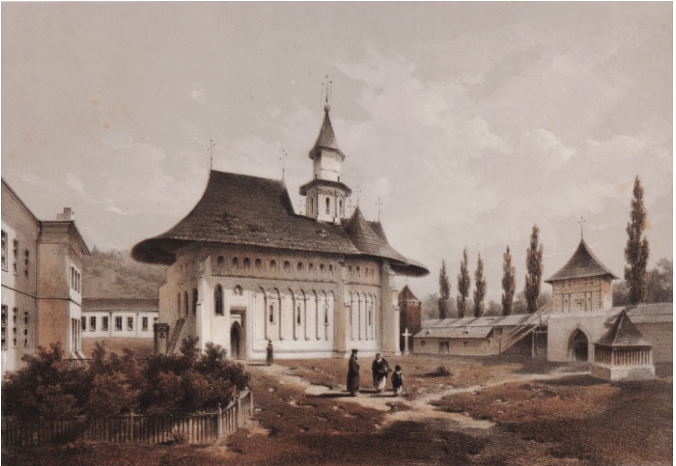
Putna – 1850, de Franz Xaver Knapp

Surorilor! A venit momentul ca junimea română să manifesteze 49 conștiința unității sale naționale; a venit momentul ca junimea română să o 50 zică în fața lumii că e îndestul matură 51 spre a-și cunoaște chemarea sa 52 socială în Orientul Europei.