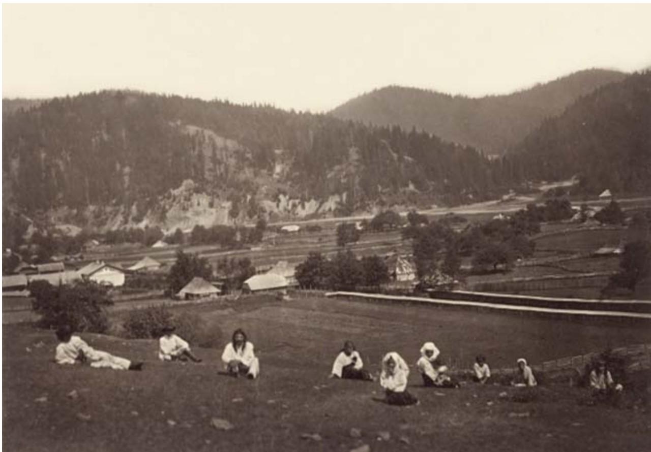
Putna

August 11 Sub semnăturile lui Ioan Slavici, președinte, și Mihai Eminescu, secretar, Comitetul pentru serbarea de la Putna înștiințează, din Cernăuți, „pe onoratul public român, cum că toate pregătirile” pentru această serbare „sunt îndrumate și speră, cu 13 august, a fi cu toate gata; nu-i rămâne acum alta nimic decât a ruga pre toți aceia ce simt adevărat românește, ca să înfrumusețeze serbarea cu prezența lor, căci comitetul este de convingere că numai o participare vie poate ridica însemnătatea acestei serbări naționale. O adunare numeroasă de români din toate provinciile române însuflețită de unul și același spirit, aceasta este podoaba, frumusețea și sublimitatea serbării, iar nu flamurile împlântate și arcurile de triumf”, în continuare se dau indicații în legătură cu mijloacele de transport și cazare la Putna, precum și alte lămuriri organizatorice.