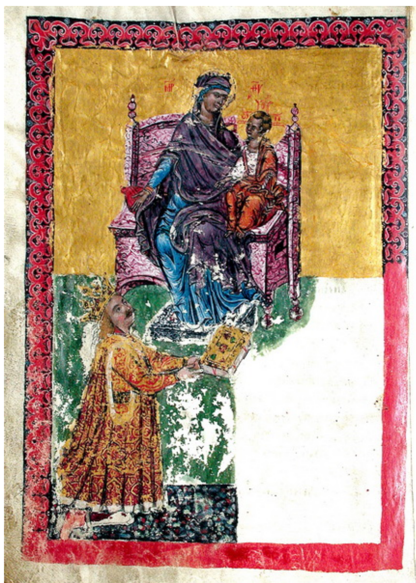
Portretul lui Ștefan cel Mare din Tetraevanghelul de la Humor (1473)

D[umnea ]lor domnilor auditori la Facultatea teologică din Blaș