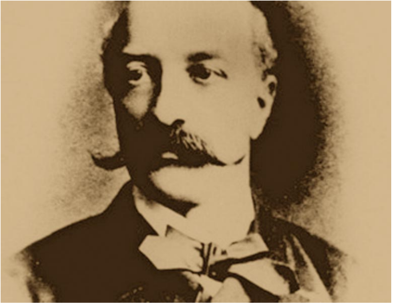
Iacob Negruzzi.

“(...) Împrieteniți din cel întâiu moment am stat mai bine de o săptămână în Viena, petrecând tot timpul cu Eminescu, discutând împreună despre trecutul și viitorul românilor, despre războiul franco-german ce tocmai izbucnise și pasiona toată lumea și mai ales despre literatura noastră națională.